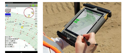
FC-6000A (7 インチ)

公共測量、地籍測量に対応した GNSS 基線解析、網平均処理、帳票出力の全てが行えます。また、国土地理院発行「マルチ GNSS 測量マニュアル (案) - 近代化 GPS、Galileo 等の活用 -」に則った最新の観測方法が活用できます。