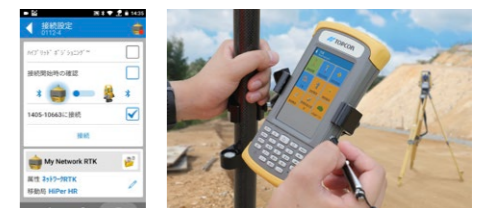
FC-600 (4.3 インチ)