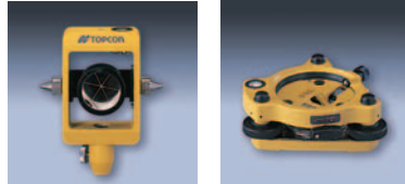
ピンボールプリズム セットL1型