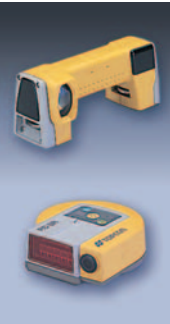
リモートコントロールシステム RC-3