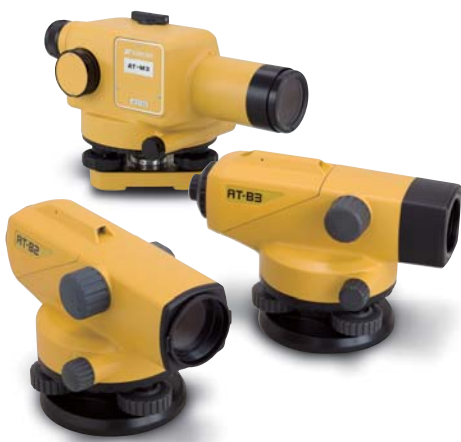
AT-Bseries/AT-M3 AUTO LEVEL