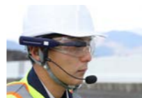
LN-100 ウェアラブルシステム 杭ナビ Vision