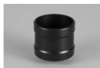
ATP ガード (360°プリズムプロテクター)