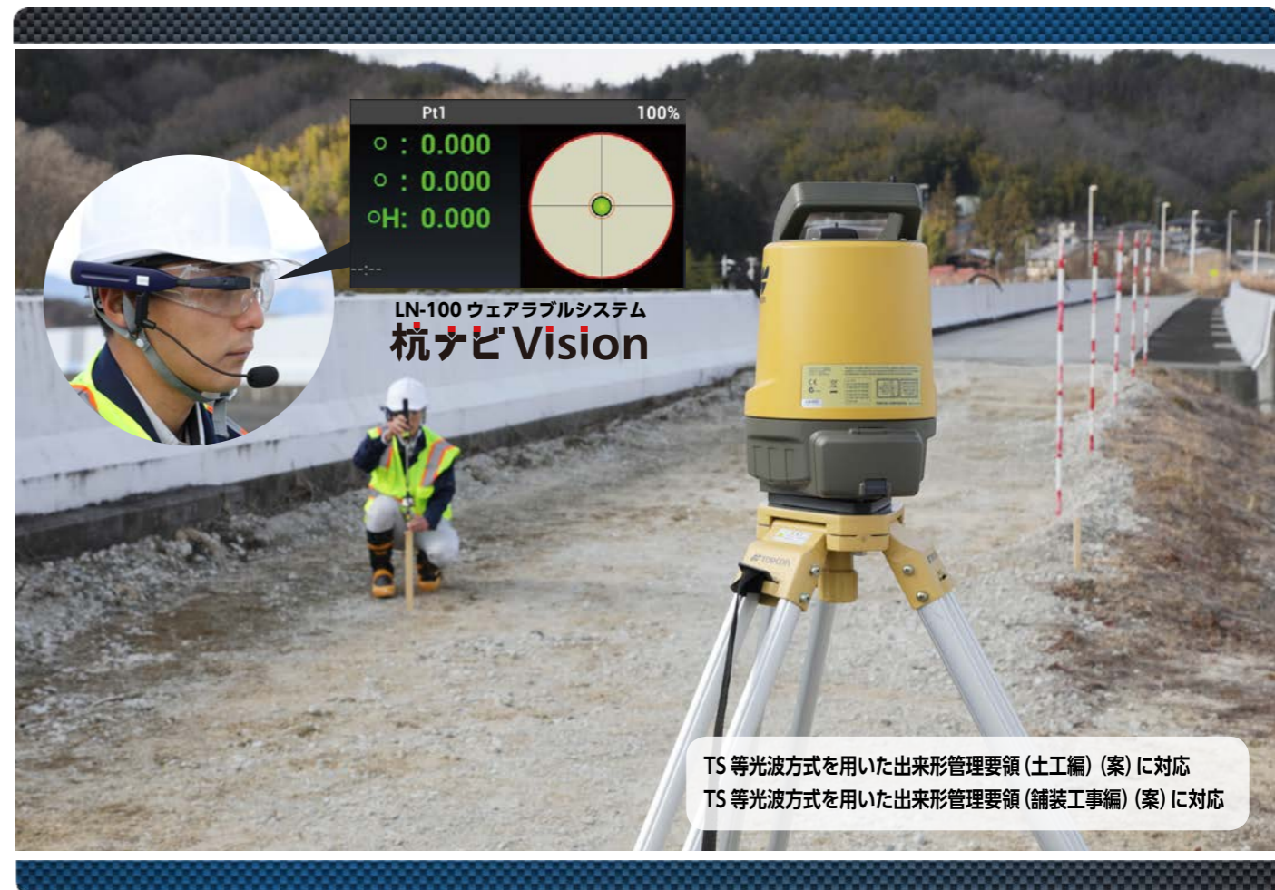
LN-100 ウェアラブルシステム 杭ナビ Vision

TS 等光波方式を用いた出来形管理要領 (土工編) (案) に対応 TS 等光波方式を用いた出来形管理要領 (舗装工事編) (案) に対応