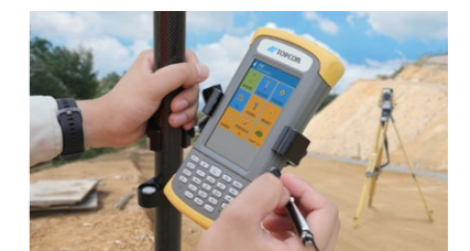
FC-600 (4.3 インチ)

公共測量作業規程に準拠した測量業務に加え、路線設計等の土木施工に対応した機能も搭載し、幅広い分野で運用が可能です。