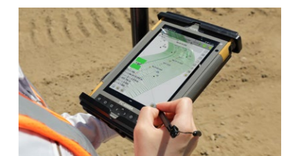
FC-6000A (7 インチ)